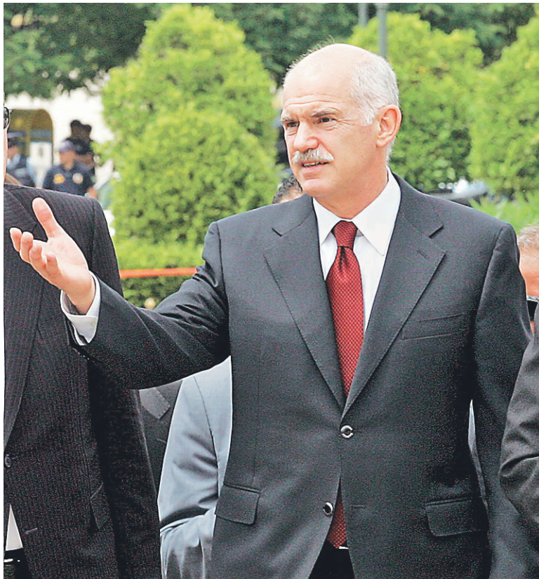
Papandreou dijo que el Parlamento griego está analizando las prácticas de los grandes bancos y no descartó acciones legales.

“Se están realizando investigaciones similares en otros países y en Estados Unidos (...). Escucho las palabras fraude y falta de transpa-